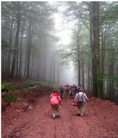
Barro en el Camino. Mercedes Forniés. 2017. Fotografía.